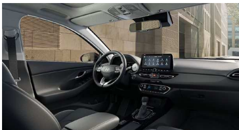
Černý interiér Oceanidis Black Premium – kožené čalounění sedadel – světlé čalounění stropu a obložení bočních sloupků – černé provedení přístrojové desky a výplní dveří