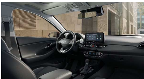
Černý interiér Oceanidis Black Premium – kožené čalounění sedadel – světlé čalounění stropu a obložení bočních sloupků – černé provedení přístrojové desky a výplní dveří