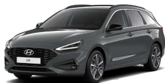
Ecotronic Gray Pearl Perleťová Cena: 16 900 Kč