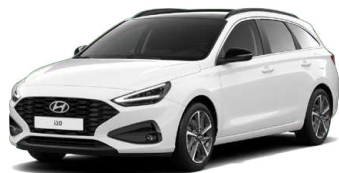
Atlas White Pastelová Cena: 5 900 Kč