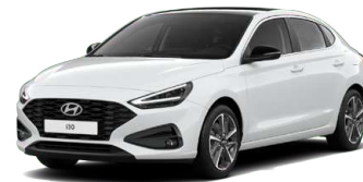
Serenity White Pearl Perleťová Cena: 16 900 Kč