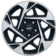
16" kola z lehké slitiny