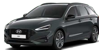
Cypress Green Pearl Perleťová Cena: 16 900 Kč