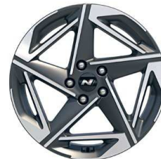
18" kola z lehké slitiny – N Line

* K dispozici pro vozy vyrobené do 9/2024.