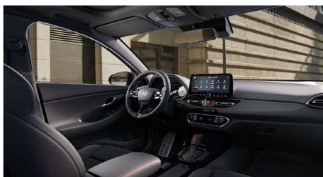
Černý interiér N line Premium – prémiové čalounění v kombinaci kůže/semiš – červeně prošívání sportovní volant, hlavice řadící páky a loketní opěrka