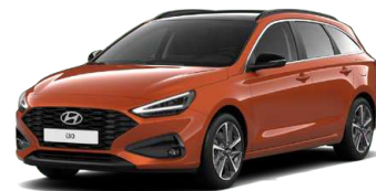
Jupiter Orange Metallic Metalická Cena: 16 900 Kč