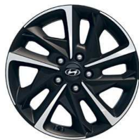
17" kola z lehké slitiny