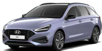
Meta Blue Pearl Perleťová Cena: 16 900 Kč