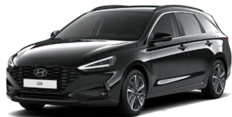
Abyss Black Pearl Perleťová Cena: 16 900 Kč