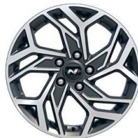
17" kola z lehké slitiny – N Line