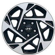
16" kola z lehké slitiny