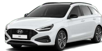
Serenity White Pearl Perleťová Cena: 16 900 Kč