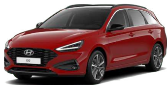
Engine Red Pastelová Cena: 0 Kč