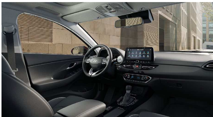
Černý interiér Oceanidis Black – látkové čalounění sedadel – světlé čalounění stropu a obložení bočních sloupků – černé provedení přístrojové desky a výplní dveří