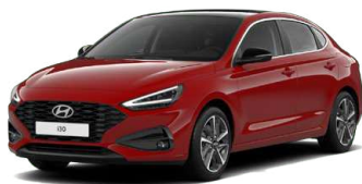
Engine Red Pastelová Cena: 0 Kč