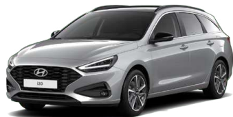
Shimmering Silver Metallic Metalická Cena: 16 900 Kč