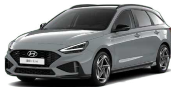
Shadow Gray Pastelová Cena: 16 900 Kč Dostupná pouze pro výbavy N Line