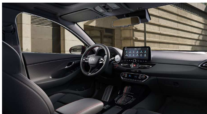
Černý interiér N line Premium – prémiové čalounění v kombinaci kůže/semiš – červeně prošívání sportovní volant, hlavice řadící páky a loketní opěrka